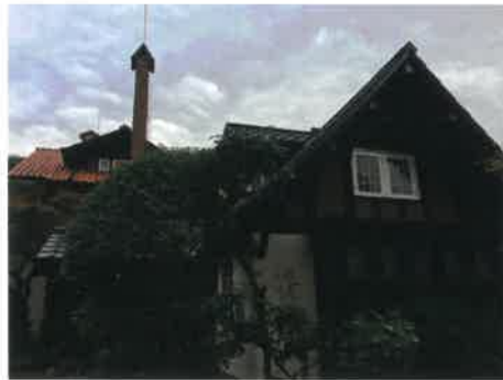
大山崎山荘美術館

次に訪れた宝積寺では、本尊である「十一面観音立像」には会えませんでしたが、閻魔堂に並んだ「閻魔王」以下5軀の冥官群像があり、初めて閻魔さん以外の方に会うことができました。