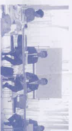
有意義な意見交換ができました

平成21(2009)年度の一般会計予算として、市税収入が平成20(2008)年度約650億円から約634億円と約16億円と前年度比で2.5%減少しているにもかかわらず、予算額が平成20年(2008)年度約1,057億円から約1,100億円と前年度比で4.1%増加しています。これは今年度か北工場(ごみ焼却場)の建替最終年度となり、建替関連予算が増加したことが大きな要因であるとの説明でした。(表をご覧ください)